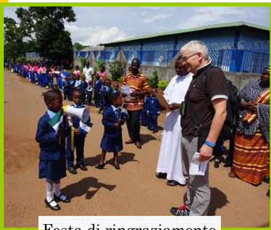
Festa di ringraziamento